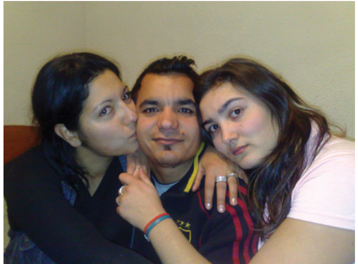
Photographie 4. Mon hôte, encore célibataire au début de mon enquête de terrain, entouré de deux amies lors d'une soirée entre jeunes organisée chez lui.