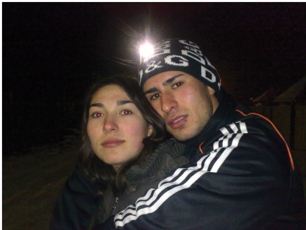
Photographie 3. Les petites rues mal éclairées du village étaient, à la fin des années 2000, un endroit idéal pour les jeunes amoureux. Ils pouvaient ainsi se tenir enlacés en dehors des regards des parents et des voisins.