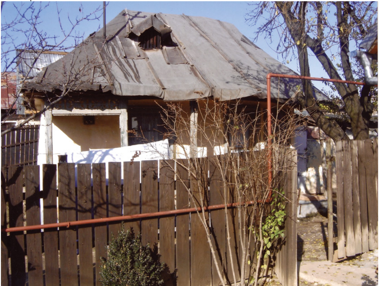
Photographie 5. La vieille maison de famille ( casa bătrânească ) de Maria au début des années 2000. La proximité des maisons voisines, juste derrière, et les clôtures minimales, participent à cette géographie affective où beaucoup se voit et tout s'entend. Avec la construction de nouveaux portails, maisons et clôtures, cette géographie s'est modifiée. Photographie tirée de l'album de famille de Maria, scannée et reproduite avec son aimable autorisation.